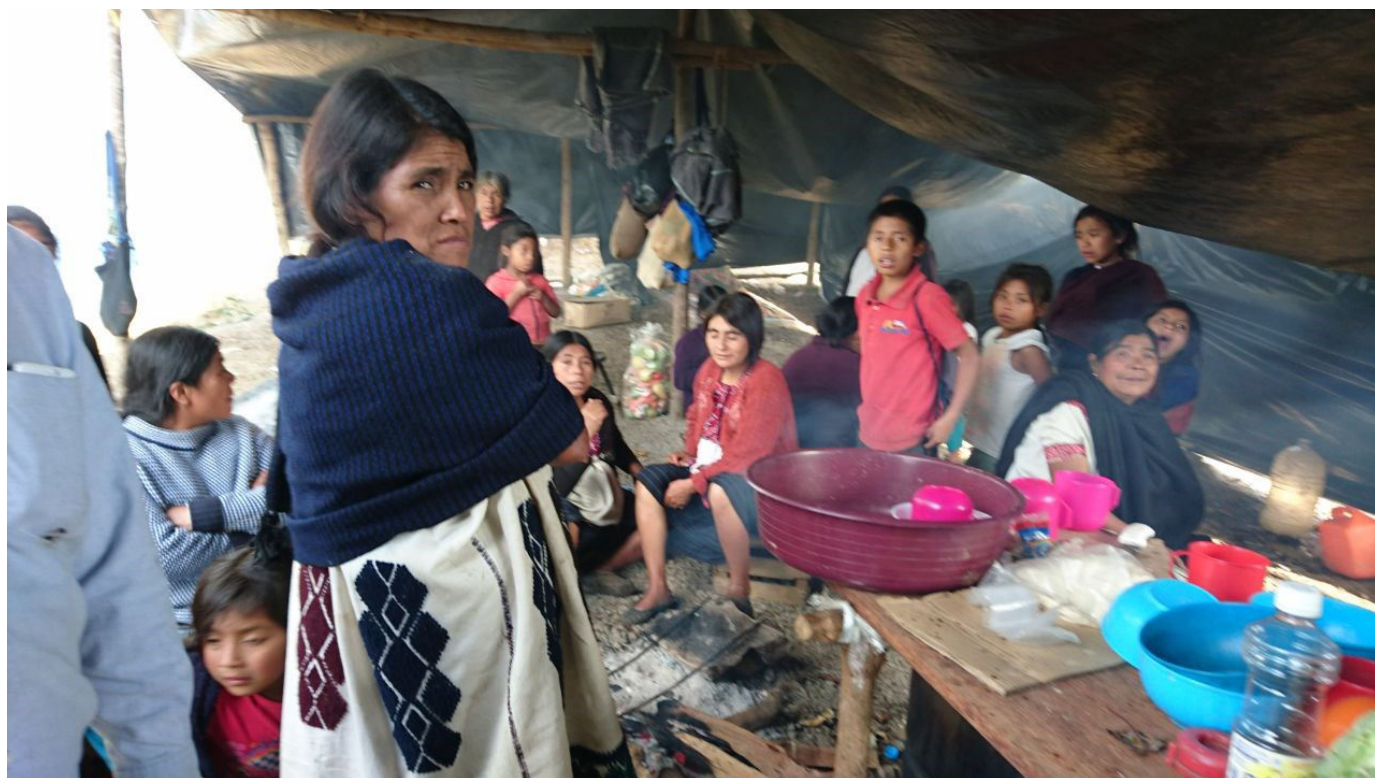
FOTO, Apoyo a afectados por sismo y desplazados en Chalchihuitan y Chenalhó