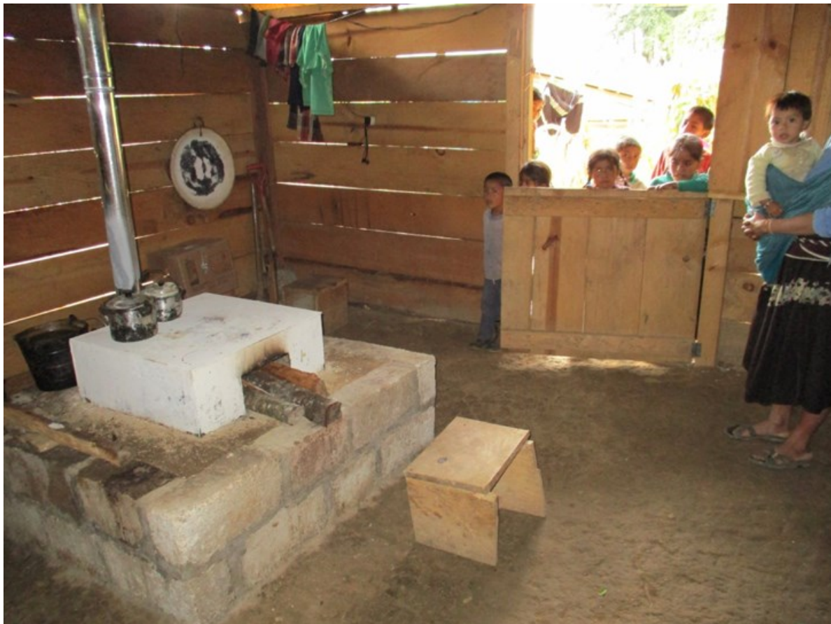
FOTO, fogón ecológico